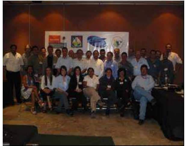
3° Foro para el Sector Productivo Ostión