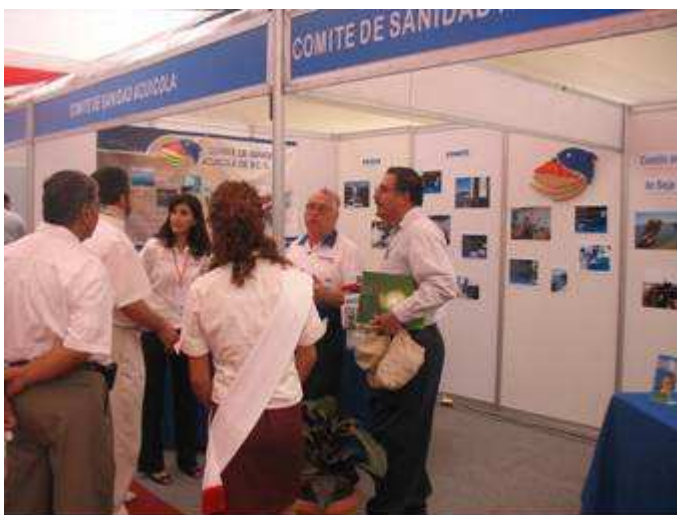
Expo Canacintra 2007

Durante estos eventos se entrego al público material de difusión relativo a la importancia de mantener limpias las aguas de nuestro estado. En ambos casos la afluencia de personas fue muy buena.