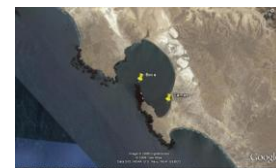
b) Bahía Tortugas