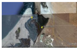
a) Laguna de Guerrero Negro

Este estudio se llevará a cabo en 9 sitios donde se cultiva ostión japonés en el estado de B.C.S: Divididas en dos áreas Pacifico Norte que incluyen los siguientes cuerpos de agua: Laguna Guerrero Negro, Bahía Tortugas, Estero La Bocana, Estero El Coyote, Estero El Cardón (Figura 1). La zona Pacifico Centro que incluye las siguientes sitios: Estero Santo Domingo, Estero San Buto (Sistemar, Argos Acuicultores) y Estero Las Botellas (Figura 2).