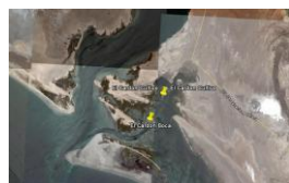
e) Estero El Cardón