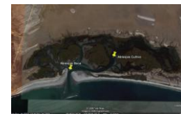
d) Estero El Coyote Punta Abreojos